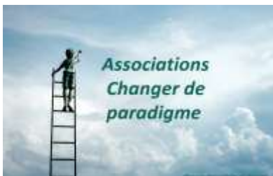
Associations Evolution ou Révolution?